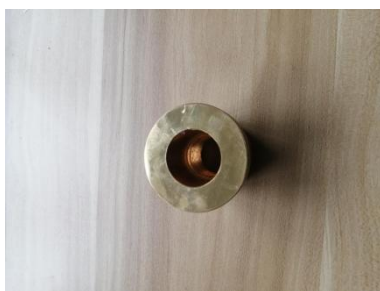
安放铜垫片的铜套